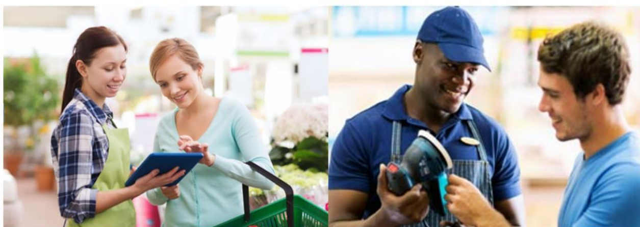
EQUIPIER POLYVALENT DU COMMERCE